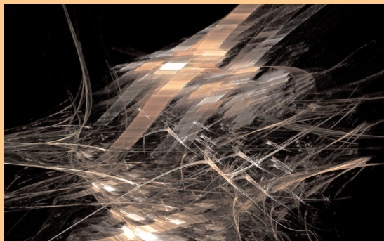
Illustration: Création numérique 2009 Steven Marc avec son aimable autorisation